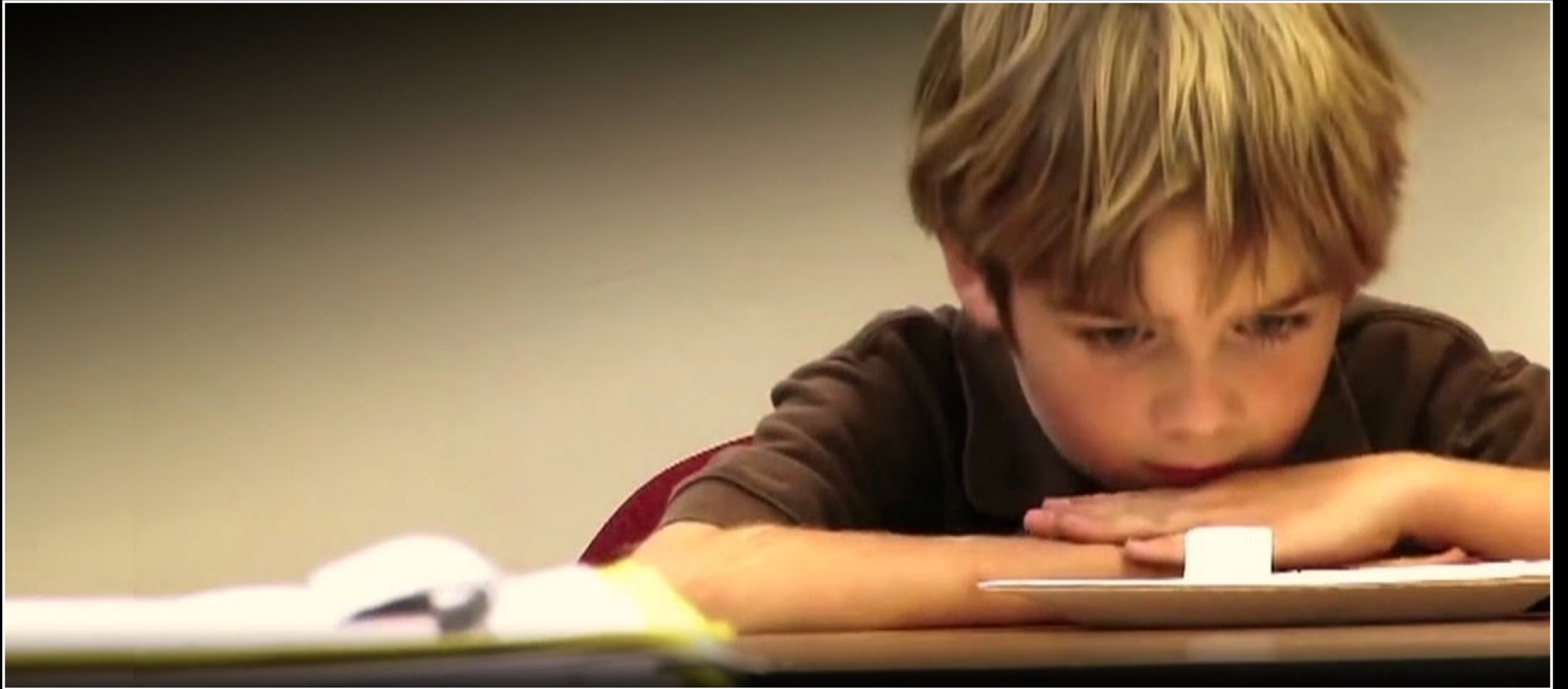
The Marshmallow Test